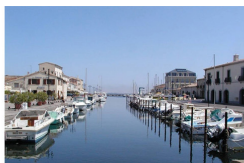
Résidence Rive Gauche