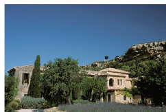
Abbaye de Sainte Croix