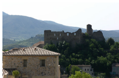
Domane Des Pins

En cours de réalisation : Les Jardins de Saint-Benoît, Saint-Laurent de la Cabrerisse (11) ; Les anciens Chais Rive Gauche, Port de Marseillan (34) ; Le Château de la Redorte, La Redorte (11) ; La Distillerie des Templiers, Pézenas (34).