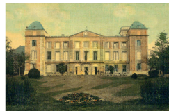
Château de La Redorte