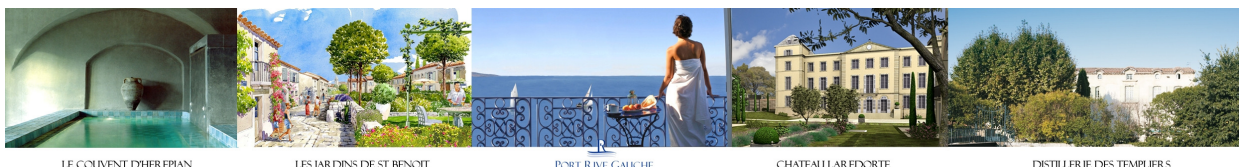
LE COUVENT D'HERÉPIAN

Galivel & Associés - Carol Galivel / Pascale Pradère - 01 41 05 02 02