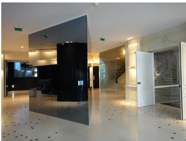
La banque d'accueil