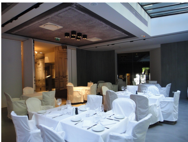
Le Restaurant – Panneaux pivotants menuisés éclairés et plafond toile tendue acoustique imprimée