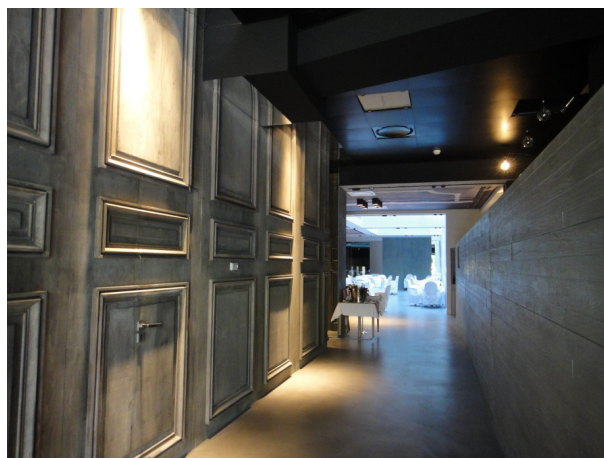
La zone bar – Panneaux en CP brut traité avec des moulures et donnant écho au revêtement en ductal (hors lot) de l'ensemble bar situé en face dont les aménagements ont été réalisés par Myhs