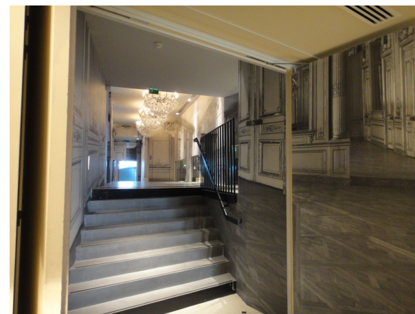
Circulation principale – Murs traités en papier peint trompe l'œil, miroirs, et donnant accès à la zone ascenseur traité à la feuille d'argent