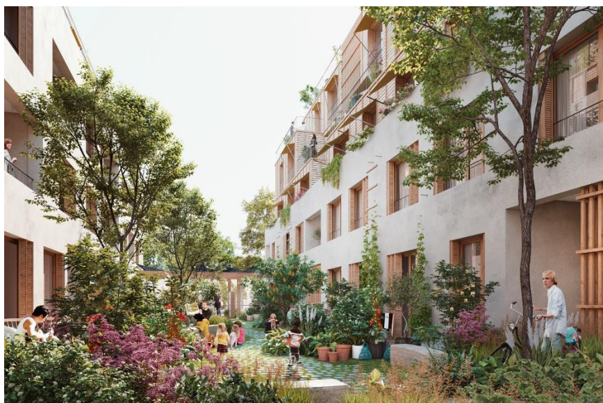
Résidence "Paris Venelles"

Matériaux biosourcés, toitures végétalisées, approvisionnement de matériaux par voie fluviale, bâtiments à très faible consommation énergétique : GIBOIRE intègre une exigence environnementale forte à ses projets. Ainsi, la résidence Ascension Paysagère de 138 logements à Rennes répond au cahier des charges du label PassivHaus sur une partie de ses logements et est certifiée NF habitat HQE. Dans le 20 ème arrondissement, le programme Paris Venelles est conçu presque intégralement en bois et porte l'ambition du « Triple Zéro » (zéro carbone, zéro déchet et zéro rejet). Il a, d'ailleurs, obtenu le label BiodiverCity® qui atteste du respect de la biodiversité et de la haute qualité environnementale d'un projet. «