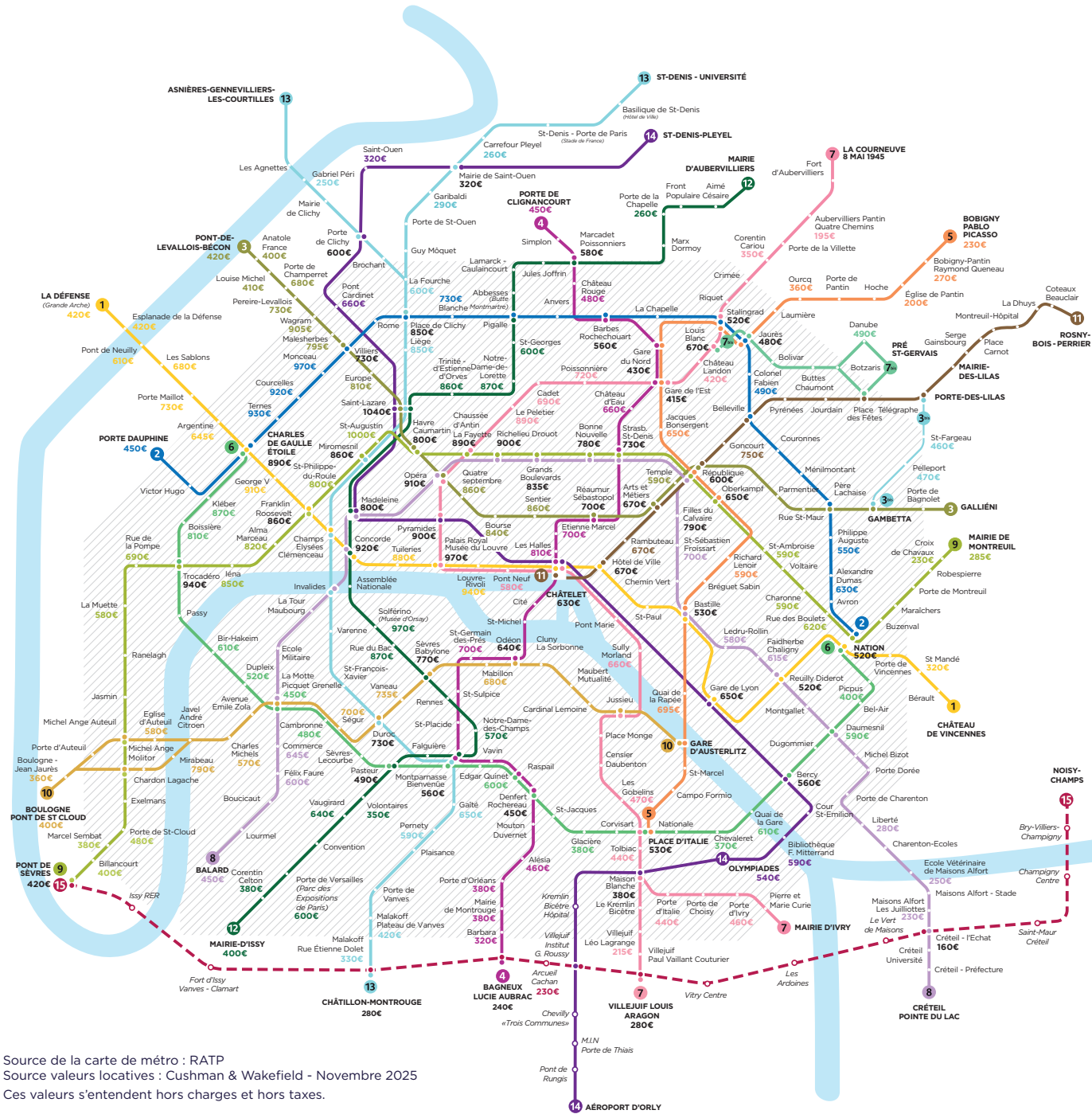
Source de la carte de métro : RATP Source valeurs locatives : Cushman & Wakefield - Novembre 2025 Ces valeurs s'entendent hors charges et hors taxes.

Paris Intra-muros. Méthodologie affinée par calcul de pondération par les surfaces et par corrections à dire d'expert. Les valeurs sont référencées par les offres définies à un instant T sur le marché. Rayon d'échantillonnage de 350 mètres autour des stations intramuros, à Neuilly et à La Défense et 500 mètres sur les autres marchés extramuros.