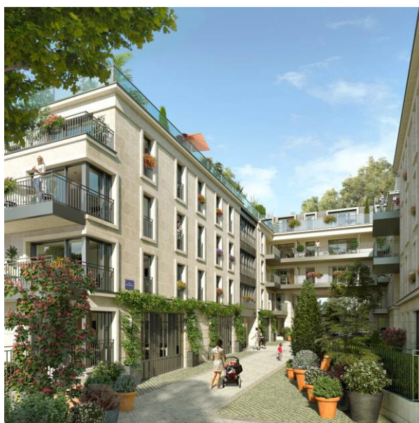
Antony – VILLA PARC BOURDEAU