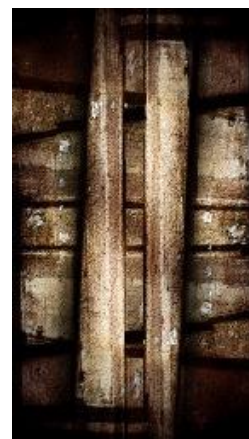
Spirit Wall, 2011

Entre les assemblages de charpentes qui structurent l'espace et les trous noirs qui nous entraînent dans leur vertige, l'œuvre d'Olivier Dassault est un combat visuel qui nous mène aux confins du visible. Le « Guerrier de la Lumière » comme l'a qualifié Winn'Art.