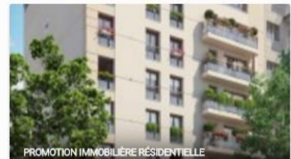
PROMOTION IMMOBILIERE RESIDENTIELLE

Projet financé Févr. 2016 11% annuel 73 commentaires