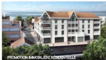
PROMOTION IMMOBILIERE RESIDENTIELLE

Projet financé Févr. 2016 9,5% annuel 57 commentaires