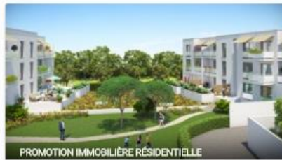
PROMOTION IMMOBILIERE RESIDENTIELLE

Projet financé Janv. 2016 10% annuel 76 commentaires