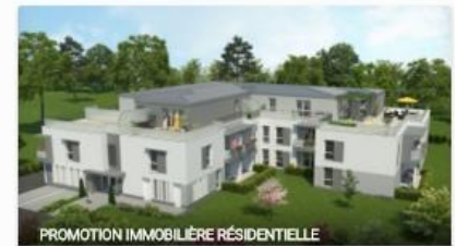
PROMOTION IMMOBILIERE RESIDENTIELLE

Projet financé Janv. 2016 12% annuel 37 commentaires