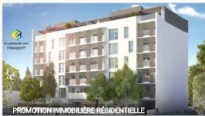
PROMOTION IMMOBILIERE RESIDENTIELLE