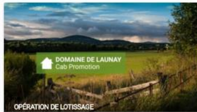
OPÉRATION DE LOTISSAGE

Projet financé Déc. 2015 11% annuel 26 commentaires