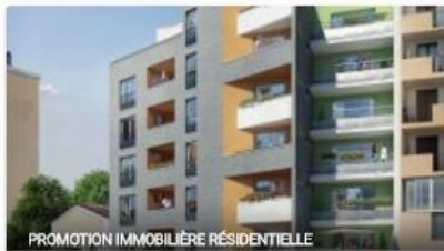
PROMOTION IMMOBILIERE RESIDENTIELLE

Projet financé Janv. 2016 9% annuel 30 commentaires