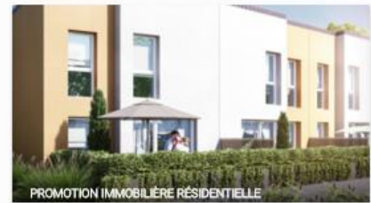
PROMOTION IMMOBILIERE RESIDENTIELLE

Projet financé Mars 2016 10% annuel 115 commentaires