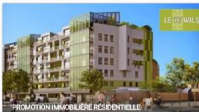
PROMOTION IMMOBILIERE RESIDENTIELLE

Projet financé Févr. 2016 10% annuel 98 commentaires